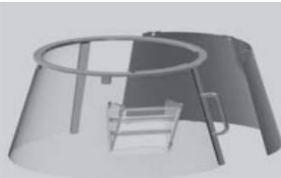
Protezione fissa/girevole in plastica "F" Fixed rotating plastic safety guard "F"