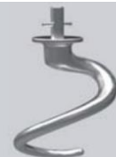
Spirale in alluminio Aluminium spiral