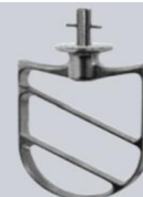
Spatola in alluminio Aluminium beater