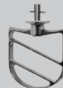
Spatola in alluminio Aluminium beater