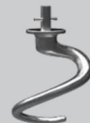
Spirale in alluminio Aluminium spiral